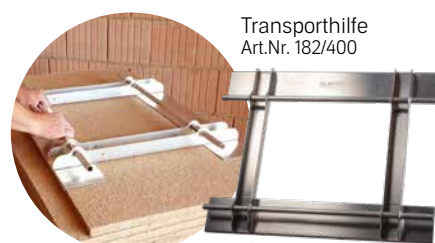
Transporthilfe Art.Nr. 182/400