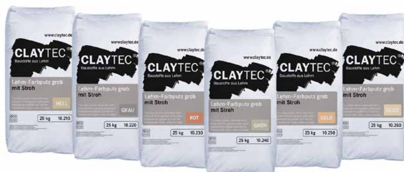
Je Farbton unterschiedliche Gebindelayouts